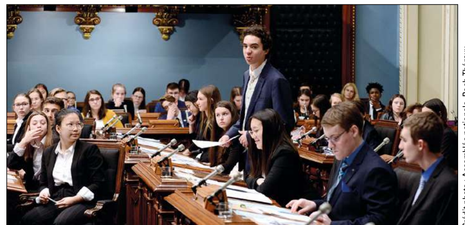
Le porte-parole du gouvernement sur le projet de loi 3, Rwann Vonarx, debout.