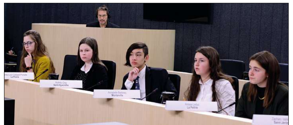
La députée Anissa Leduc, première à partir de la droite.