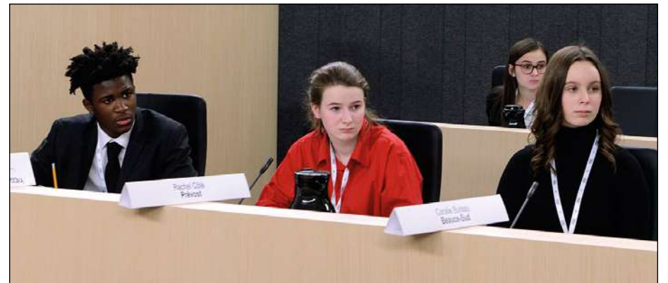
Le député Ghislain Amos Boum Nlend, à gauche sur la photo.