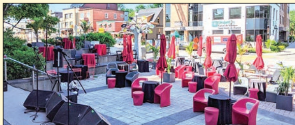
La place éphémère Charles-H.-Blais a accueilli deux spectacles de jazz cette année, pour la soirée Jazz au clair de lune.

De plus, cette année deux spectacles de jazz ont attiré de très nombreux amateurs de ce type de musique lors d'une soirée très agréable. Un franc succès. ■