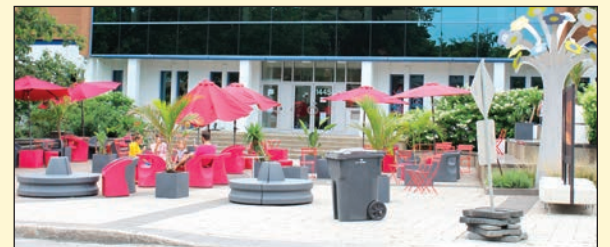
Les familles en profitent pour déguster des produits des restaurateurs et des commerçants de l'avenue Maguire, dont de la crème glacée.